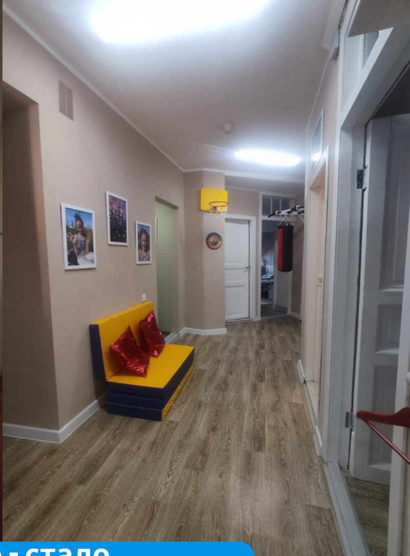
было - стало